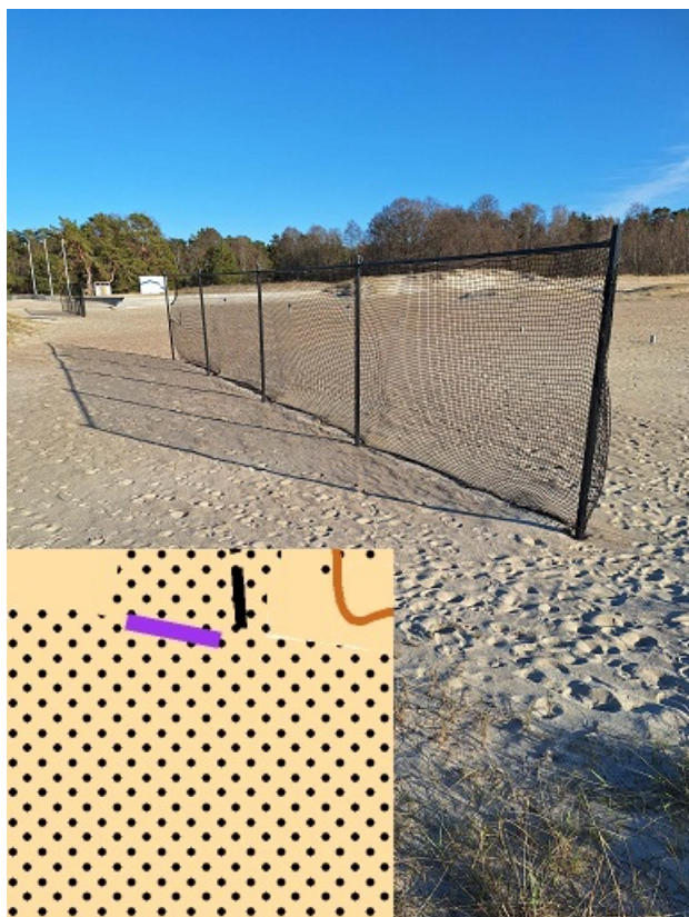
Liivaplatsidel olevad võrkpalli, padeli ja jalkavärava võrgud on tähistatud lilla joonega 709.004 (Keeluala piir).