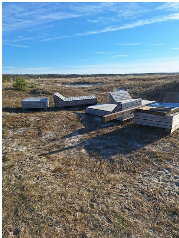
Maastikul on ka kaardistamata mööblit, mida sel nädalal ümber paigutatakse. Need näevad välja sellised.