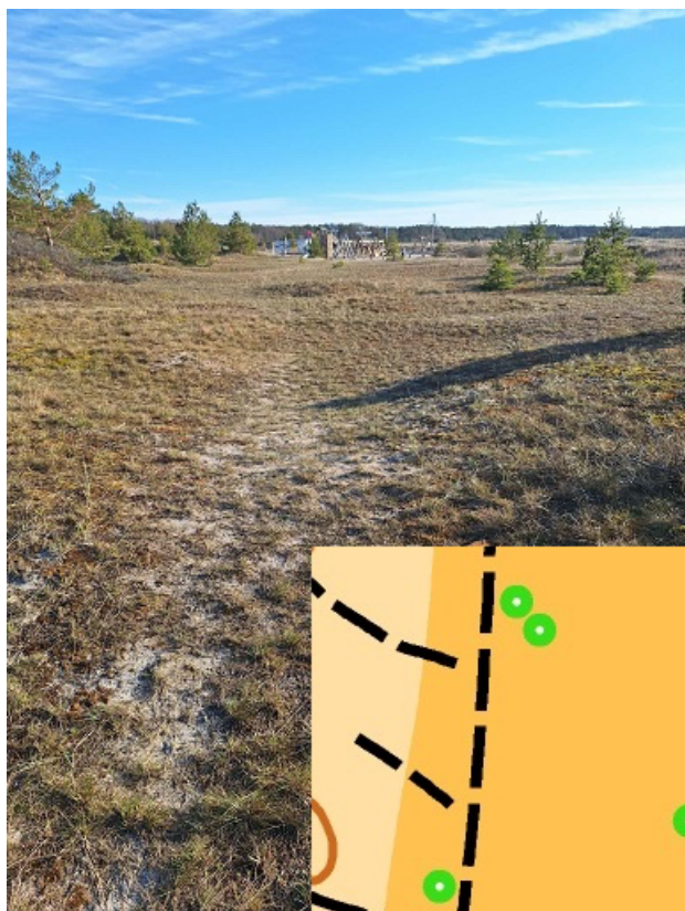
Lage ala 401.000 on sambla ja muu väga madala taimestikuga kaetud.