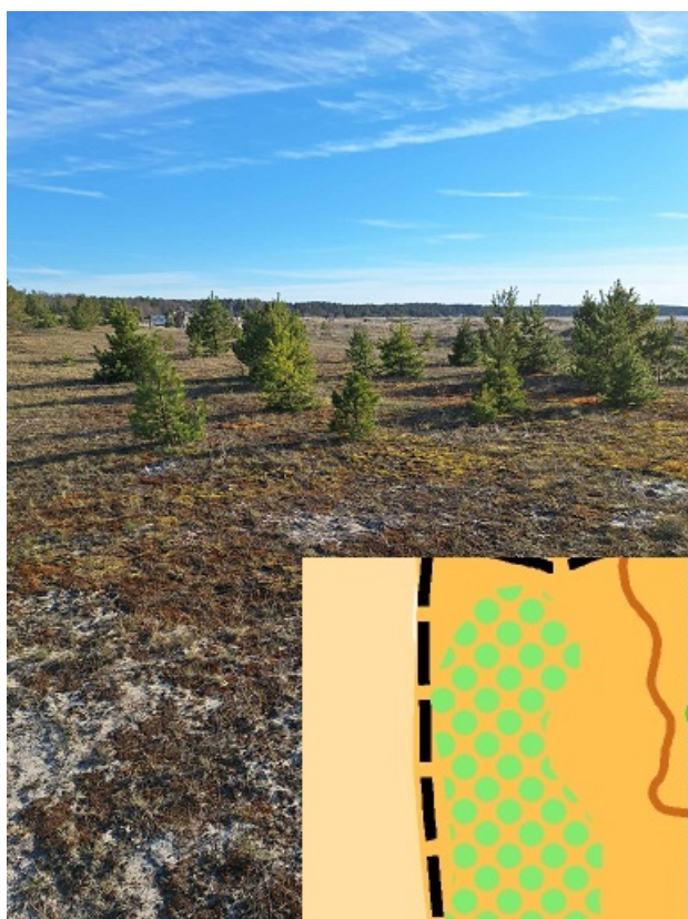
Lage ala harvade puudega on kaardil leppemärgiga 402.001, selle tihedus varieerub.